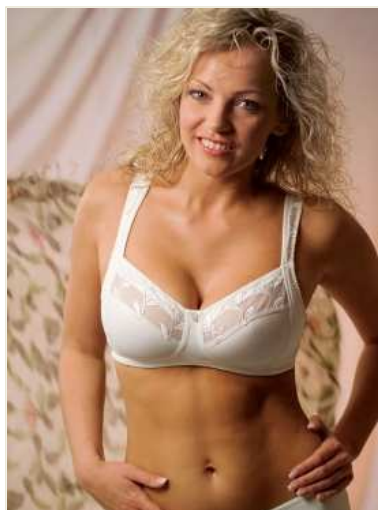
En BH med hel kupa, men utan bygel. Bilden visar BH från Abecita, modell Jazz.

När du ska hitta din kupstorlek, är det bästa att utgå från den kupstorlek du använder. Kupstorleken är riktig när bygeln ligger helt intill kroppen och kapslar in hela bröstet. Bullar bröstet ut i sidan eller ovanför kupkanten, är kupan för liten. Kryper BH:n upp på ryggen är omkretsen för stor – BH:n ska sitta fast runt kroppen utan att strama. Skär BH-banden in i skuldran, är omkretsen förmodligen för stor. Det största stödet ska ligga i omkretsen och inte i BH-banden.